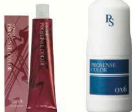
ノミネ プロセス ヘアカラー (クイック グレイカラー 全15色) 第1剤 NET120g 医薬部外品 プロセス ヘアカラー オキシ (OX8%・OX3%) 第2剤 NET1,000mL 医薬部外品